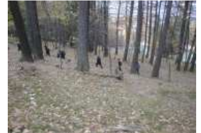
Un'escursione- lezione nei boschi