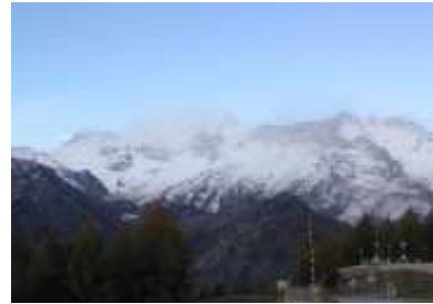
Le alpi piemontesi dove sorge il Consorzio Pracatinat

ameno, a 1650 metri d'altitudine, l'isolamento e la distanza dalla nostra regione ha fatto finalmente nascere un raffronto tra chi in Abruzzo è da sempre dalla parte della difesa dell'ambiente e della salvaguardia del territorio e ha permesso uno scambio di esperienze e metodiche seguite. Da tutti i partecipanti è poi venuta la constatazione che, mentre da un lato l'Ente Regione investe in formazione ed in sensibilizzazione alle tematiche ambientali, dall'altro autorizza interventi scellerati sul territorio ( Porto turistico Francavilla, raddoppi di strade ed insediamenti nei parchi, Centro Oli Ortona ecc.).