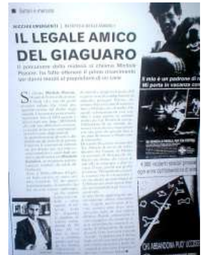
Le pagine delle riviste Oggi e Top Legal che si sono occupate della sentenza