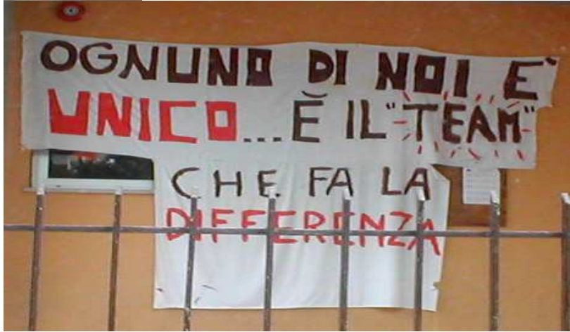
Lo striscione davanti all'elementare Alento

Lo stanno gridando forte genitori, insegnanti e studenti. Nella giornata del 30 ottobre non solo a Roma nella grande manifestazione, ma in tutt'Italia la mobilitazione è stata enorme. Forse il governo Berlusconi nella presunzione della sua inattaccabilità e nella sua insensibilità verso quanto avviene nella società non si è reso conto di quanto importante sia il mondo della scuola e quanti cittadini interagiscono con esso. Anche a Francavilla lo sciopero generale ha avuto un grande successo. In alcuni plessi l'adesione è stata del 100%. Pubblichiamo la foto del significativo striscione posto davanti alla scuola Elementare Alento con la scritta "Ognuno di noi è unico... è il "team" che fa la differenza". Miglior commento non era possibile!